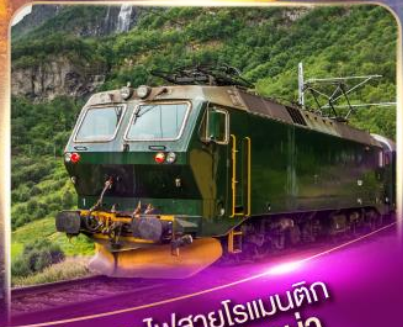
รถไฟสายโรแมนติก ฟลัมส์บานา