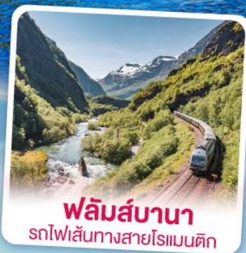
ฟลัมส์บานา รถไฟเส้นทางสายโรแมนติก